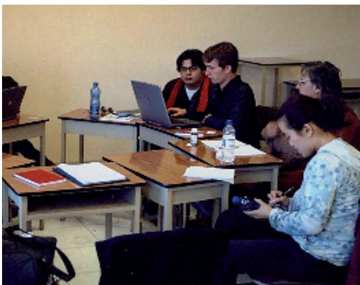
Seminar der People's Health University