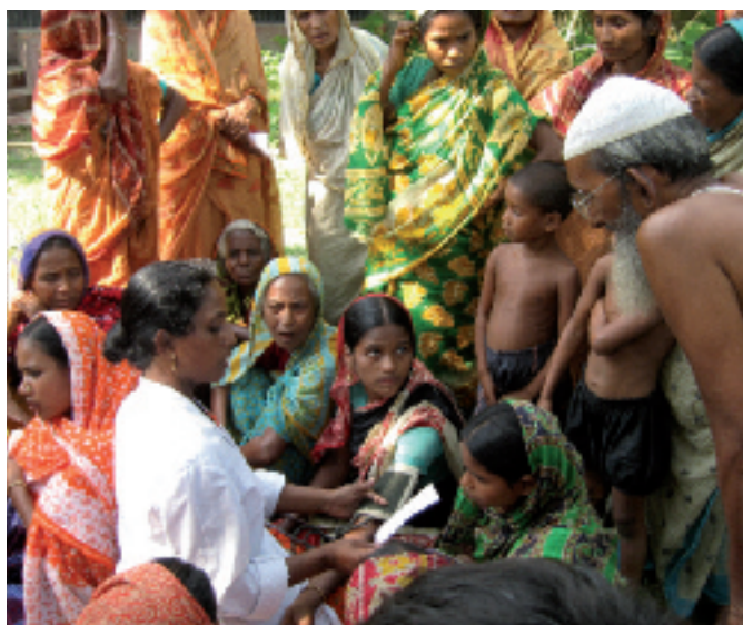
Sprechstunde einer GK-Gesundheitsarbeiterin