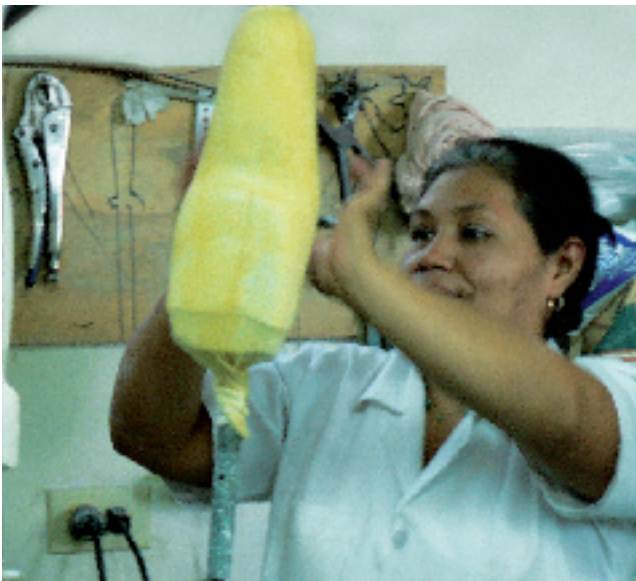
Prothesenwerkstatt von PODES

Die selbstverwaltete Prothesenwerkstatt wurde nach dem Ende des salvadorianischen Bürgerkriegs (1979-1991) von kriegsversehrten ehemaligen Guerillakämpfern gegründet. Die behinderten Prothesentechniker produzieren heute Prothesen, Orthesen und Komponenten auf internationalem Niveau. Dank der guten Qualität ihrer Produkte versorgt PODES auch Privatpatienten und Patienten der Sozialversicherung.