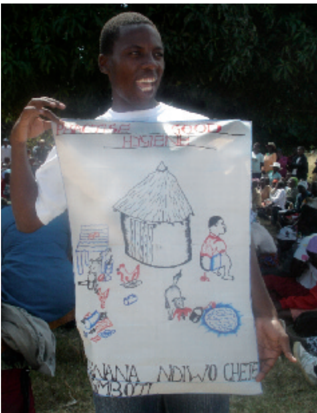
Gesundheitsaktivist in Simbabwe.

Von seinem Ursprung her ist das PHM im asiatischen Raum besonders stark vertreten. Um die Vernetzung und den Austausch auch in anderen Weltregionen zu stärken, wechselt das globale PHM-Büro in regelmäßigen Abständen seinen Standort. 2009 zog das Büro von Kairo nach Kapstadt, um die noch schwach entwickelten Netzwerkstrukturen in den anglophonen Ländern des subsaharischen Afrika zu stärken, zu denen auch medico-Partner in Südafrika und Simbabwe gehören. Dabei geht es darum, die bereits bestehenden Kontakte verstärkt in die Diskussionen und Planungen des PHM einzubeziehen sowie neue Schlüsselakteure kennenzulernen. So wurde innerhalb des PHM eine Arbeitsgruppe Afrika gegründet, die sich zum Austausch über die verschiedenen Aktivitäten mittlerweile auch eine gemeinsame Internetplattform eingerichtet hat ( www.phmafrica.blogspot.com ). Ein weiteres