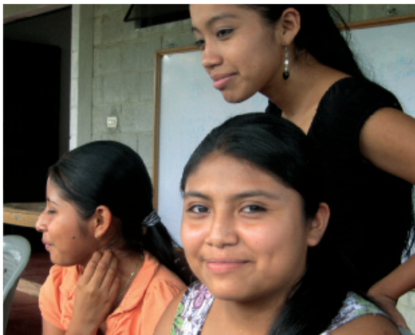
Treffen in einer indigenen Gemeinde

Um die notwendigen Grundlagen einer solchen integralen Wiedergutmachung zu schaffen, arbeiten die Gemeinden jetzt in sehr langwierigen und oft schmerzhaften Prozessen ihre kollektive Geschichte während der Zeit des Krieges auf. Neben der Möglichkeit zur öffentlichen Darstellung dieser Geschichte fordern die Gemeinden konkrete Infrastrukturinvestitionen für Häuser und Straßen, Bildungsprogramme und die Errichtung von Gedenkstätten sowie eine offizielle öffentliche Entschuldigung der Verantwortlichen. Trotz der unumgänglichen Konflikte ist so vielerorts eine positive Dynamik freigesetzt worden, in der auch die Geschichte der Gewalt in den Dörfern und zwischen den Gemeindemitgliedern zur Sprache kommt. In diesem Rahmen fördert die medico-Stiftung Fortbildungsmaßnahmen, Versammlungen von Betroffenen und anteilig das kleine Büro von ASOCDENEB.