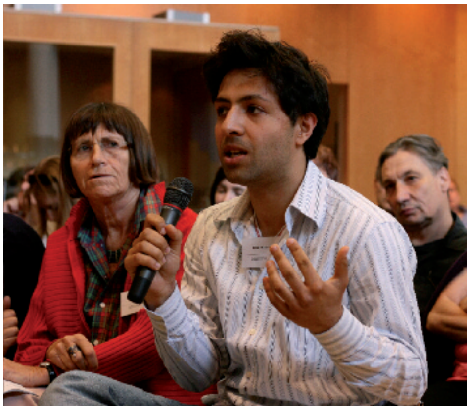
Diskussion auf dem 2009er Stiftungssymposium