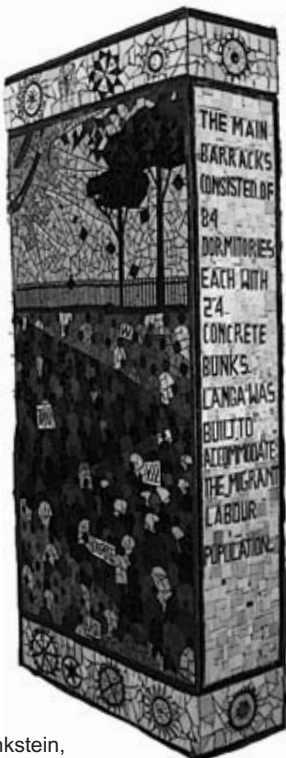
Gedenkstein, eine Station der Townshiptouren

> Am 7. März 2008 erhielt das DACPM für sein Tourprogramm auf der Internationalen Tourismusmesse in Berlin (ITB) den TODO! -Sonderpreis. Mit dem Preis des Studienkreises für Tourismus und Entwicklung e.V. werden Projekte ausgezeichnet, die im Sinne eines sozialverantwortlichen Tourismus die unterschiedlichen Interessen der ortsansässigen Bevölkerung bei Planung und Durchführung aktiv mit einbeziehen.