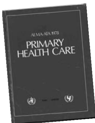
Die Erklärung von Alma Ata, 1978